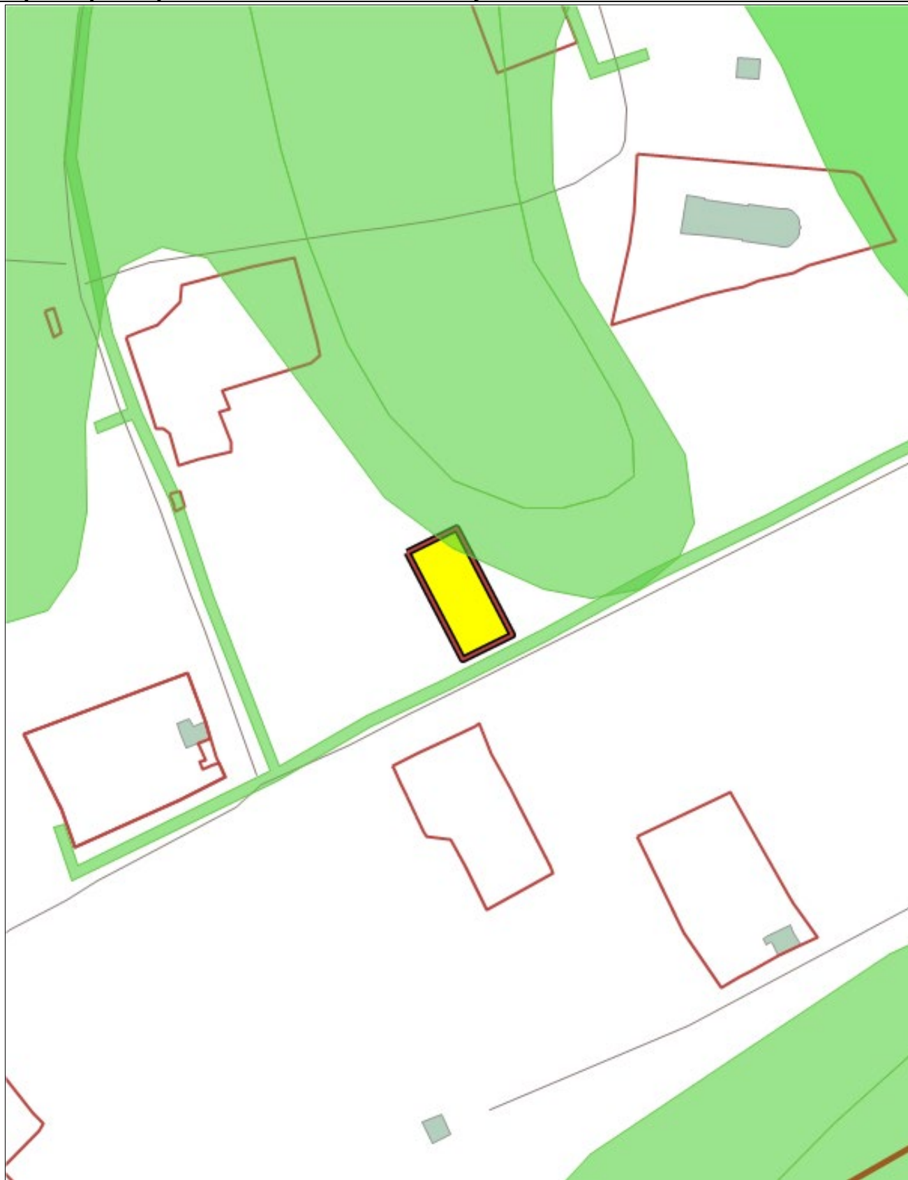
Чертёж градостроительного плана земельного участка